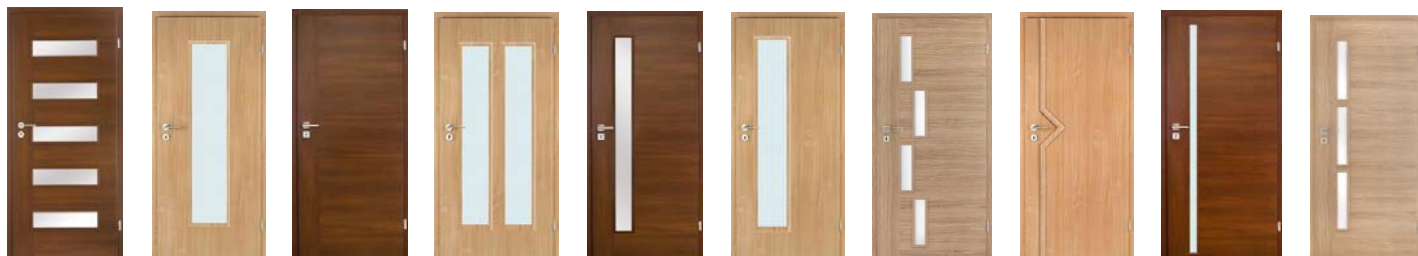
Genova Tina Tara Duo Apolo Rimini Saskia Pink Manolo Capari