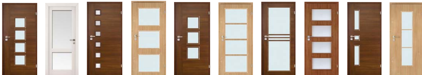
Martinik Blanko Ariel Trio Milano Kapri Kiara Megan Diana Elba

Popis produktu, jeho zloženia, výber dostupného skla, štruktúra povrchu, rozmery, cena, nájdete pri každom modeli