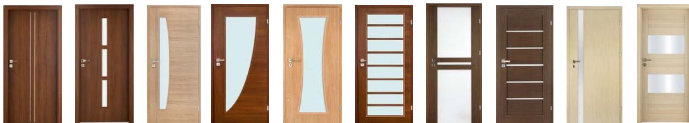
Lidus Trend Vanda Doris Liana Atena Darius plus Domos Richard Gvinea

Dvere a zárubne vo farbe čerešňa a wenge na sklade.