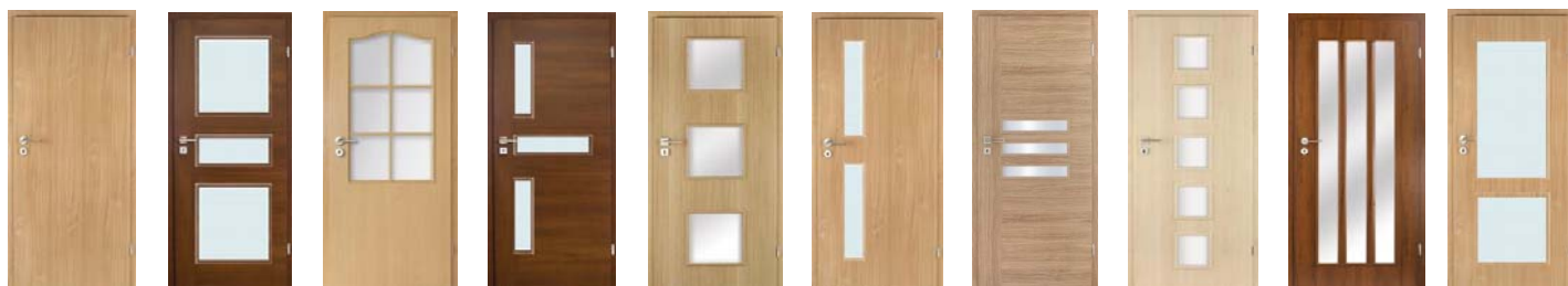
Plné Lara Rustikal Krea Rony Reno Leonard Tosca Vera Klasik